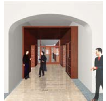
Entwurf des neuen Eingangsbereichs der JFKI-Bibliothek