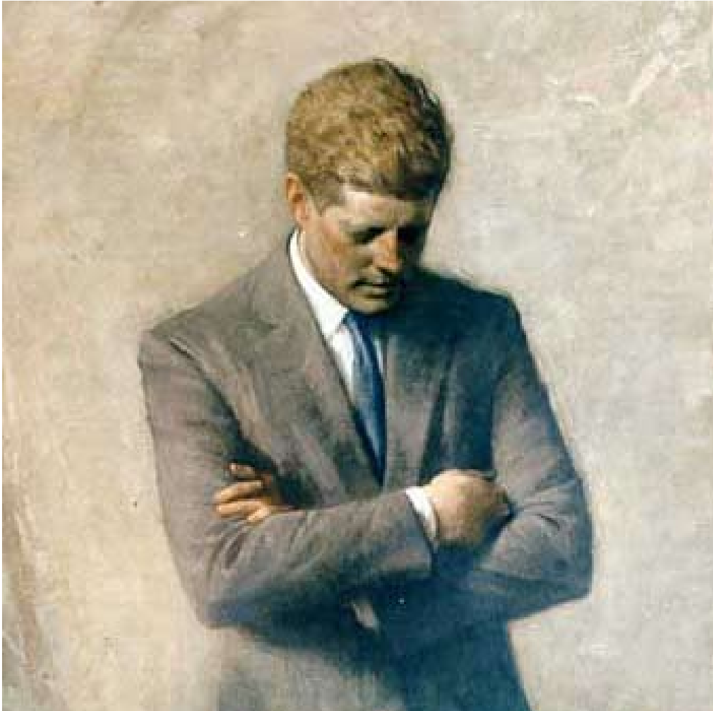
Aaron Shikler: Oil Portrait of John F. Kennedy, 1970 (White House Collection)