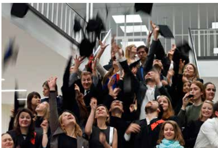
Das traditionelle Hütewerfen bei der Graduiertenfeier