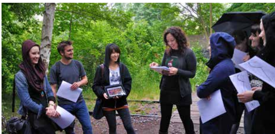
Exkursion des Seminars "The Greening of America"