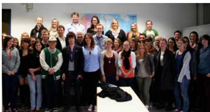
Die Workshop-Teilnehmer des JFKI und der LMU München

In der zweiten Session stand ein zweistündiger PBS-Dokumentarfilm im Mittelpunkt des Workshops. »The War of 1812« stellt den Krieg in der Chronologie der Ereignisse dar und unterstreicht in nachgestellten Szenen den militärischen Aspekt der einzelnen Gefechte von der Kriegser-