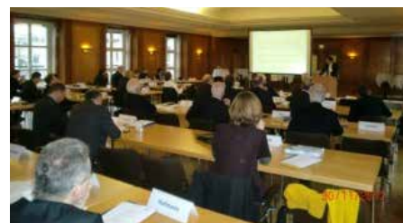
Das Symposium Staatsschulden in der Demokratie