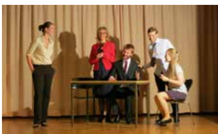
Team Scott freut sich über den Wahlerfolg