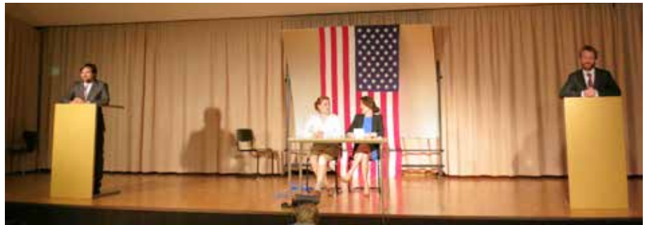
Das Fernsehduell zwischen Rob und Scott mit anschließender Wahl des Kandidaten durch das Publikum