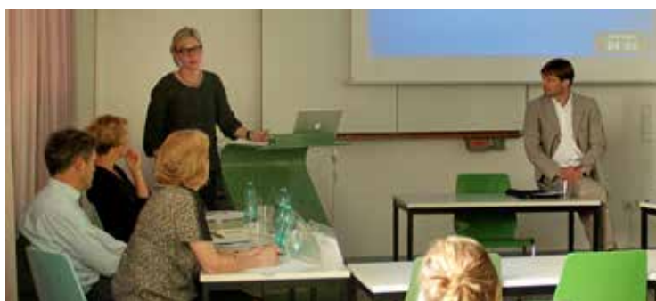
Teilnehmer der Konferenz »The Post War Moment: Historical Futures in Visual Culture«