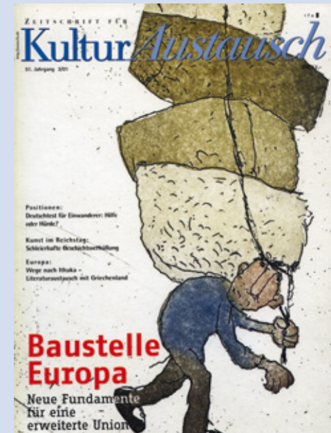
Zeitschrift für Kulturaustausch des Instituts für Auslandsbeziehungen