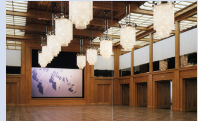
Auswärtiges Amt, Berlin, Weltsaal

17.00 Ende der Tagung und gemeinsames Abendessen der Referenten