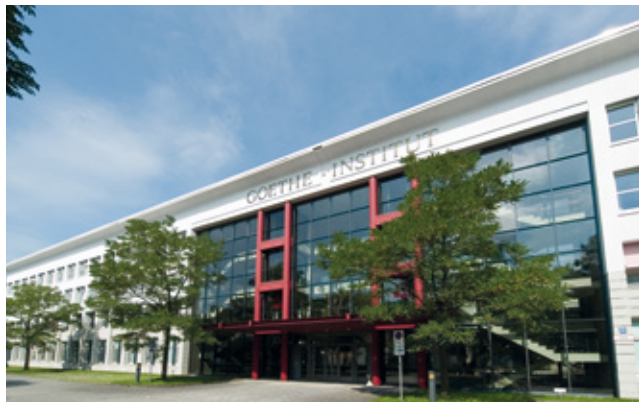
Goethe-Institut, Zentrale, München

20.00 Gemeinsames Abendessen der Referenten